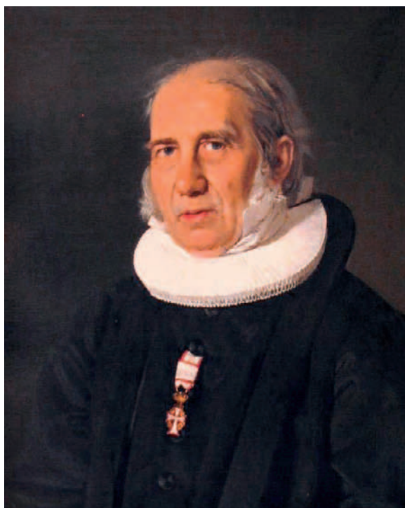
Grundtvigs tanker om frihed vil være blandt emnerne for årets udgave af Højskoledage på Havnen.