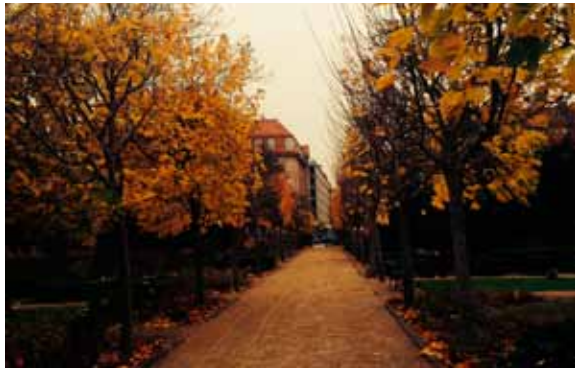
Vor Frelzers Kirkegaard

”Selvom det er en kirkegård, så er der plads til liv. Her er dagligt besøg af alt lige fra dagplejemødre med barnevogne og til børneha-