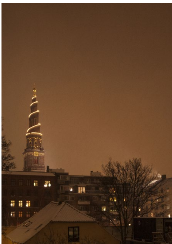
Tårnet i juledragt.

Forklædt som voksen er en titel, der appellerer til os. Mange mennesker indrømmer ligefrem, at de har bevaret barnet eller det barnlige i sig, men blot er blevet – ja, forklædt som