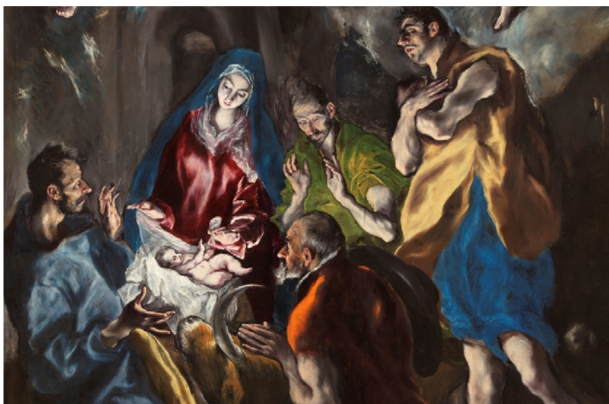
El Greco, Hyrdernes tilbedelse (udsnit)

For dem, der længes, sørger og savner, er forventningens tid stadig en sorgens tid, en tid til at mindes og måske også en tid til at videreføre måder og traditioner uden en elsket person. Nogle oplever at måtte forsvare, at julesorgens tyngde hører med til billedet af hvem vi er – trods juleglimter og glimmer.